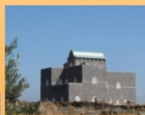
il monasterino provvisorio