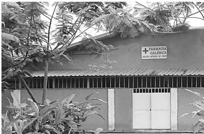
FARMACIA E LABORATORIO ANALISI

E inoltre: quanto è grande il lavoro che grava sulle spalle delle donne? Basta andare nei villaggi e osservare le mamme, con il pesante cesto in testa e il bimbo sulla schiena.