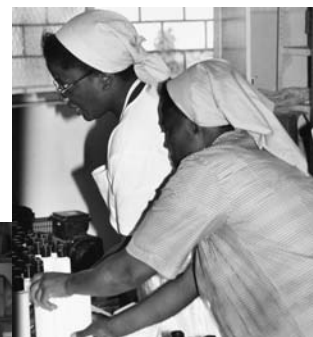
LABORATORIO GALENICO DEL SOKE