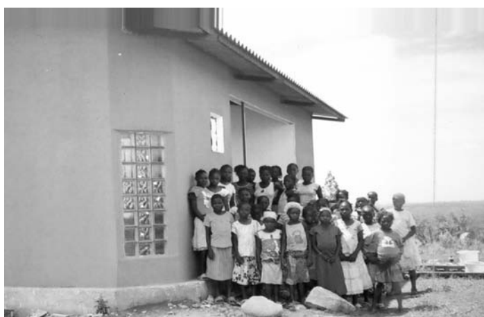
CASA LARANJA - GRUPPO ASPIRANTI

Casa Laranja è stata ultimata. E' color arancione, bella, con vista panoramica dal punto più alto della collina del Soke. Accoglierà i missionari che seguono i nostri villaggi e i progetti in corso. Come per tutte le nuove iniziative, l'abbiamo inaugurata, ma questa volta l'inaugurazione è stata un po' diversa dal solito. Niente nastro e invitati per tagliarlo, né biscotti per gli ospiti, ma un gruppetto di circa trenta belle bimbe venute a trovarci perchè vogliono vivere con noi. Per la verità, nei villaggi era già stato distribuito un avviso nel quale si diceva che per le ragazze nostre aspiranti, avremmo