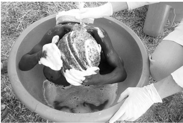
..abbiamo lavato i bambini..

nel credere che "fare beneficenza" non sia un elargire ciò che ci è d'avanzo, quanto condividere le nostre risorse con chi non ne ha.