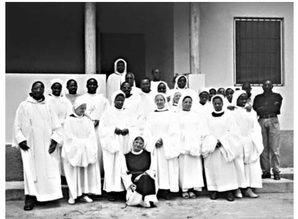
LA COMUNITA' NASSOMA Y'OMBEMBWA A SOKE

Maturano le banane, il caffè comincia a produrre, maturano gli ananas, le arance e il resto della frutta. Guardando questa terra e i suoi frutti, gli agnellini, i vitelli appena nati che crescono e saltano, alziamo gli occhi al cielo da questi millesettecento metri d'altezza e preghiamo il Signore che faccia fiorire la terra tanto cara al nostro cuore, per la sua gloria, la felicità nostra e del mondo intero.