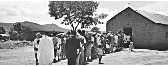
TCHILONGA: LA CHIESA